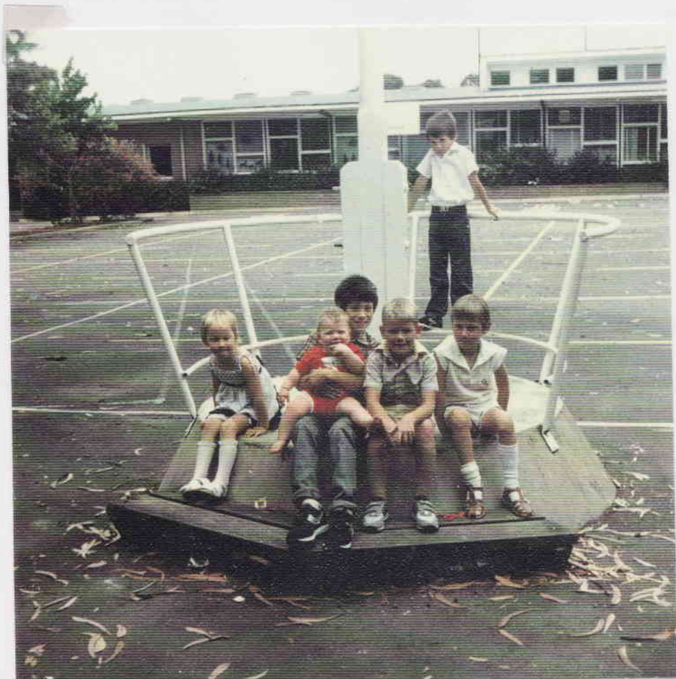
Narrabundah Primary School

© 2000 by the author All rights reserved