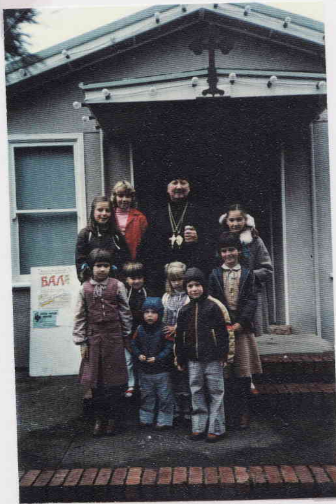
Russian Orthodox Church of St John the Baptist